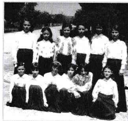
Grupul vocal al școlii

Cele mai frumoase clipe ale unui început de carieră profesională s-au întâmplat alături de acei copii minunați, dornici să învețe cât mai mult. I-am purtat pe scene cu montaje, teatru de copii, grupuri vocale ce cântau din cântece internaționale – UNICEF, i-am învățat peste programă gimnastică, să cânte la chitară, dar mai ales le-am deschis orizontul posibilităților lor. Aceste fapte au trezit invidia celorlalte cadre didactice din comună, care prin directoarea școlii din Bircii mi-a spus într-o zi, contrariată, că „de ce am venit cu televiziunea la concursuri?!?!?!”... Erau instalații de lumină făcute de mine personal, pentru un spectacol muzical coregrafic, care erau însă mai bune și decât cele ale Căminului cultural din Scornicești.