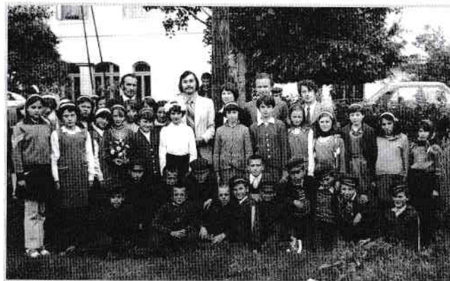
Un an mai târziu, cu clasa a V-a, căreia îi eram diriginte

Cele mai frumoase clipe ale unui început de carieră profesională s-au întâmplat alături de acei copii minunați, dornici să învețe cât mai mult. I-am purtat pe scene cu montaje, teatru de copii, grupuri vocale ce cântau din cântece internaționale – UNICEF, i-am învățat peste programă gimnastică, să cânte la chitară, dar mai ales le-am deschis orizontul posibilităților lor. Aceste fapte au trezit invidia celorlalte cadre didactice din comună, care prin directoarea școlii din Bircii mi-a spus într-o zi, contrariată, că „de ce am venit cu televiziunea la concursuri?!?!?!”... Erau instalații de lumină făcute de mine personal, pentru un spectacol muzical coregrafic, care erau însă mai bune și decât cele ale Căminului cultural din Scornicești.