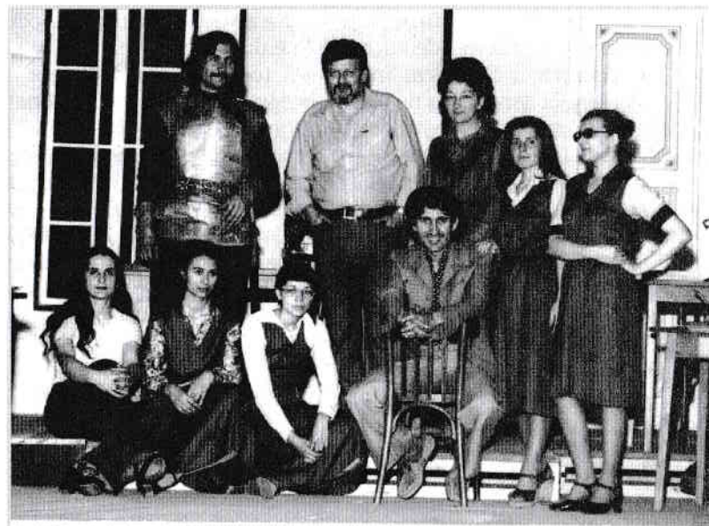
Teatru la Palatul Culturii Pitești