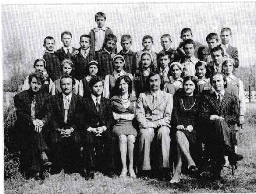
Colectivul de profesori și elevii clasei a VIII-a de la Școala Generală Negreni, în primăvara anului 1978.

Școala din Negreni a fost pionieratul meu în ale dansului, peste doi ani câștigând locul II pe țară la același concurs. Tot aici am experimentat fără să știu, comportamentul în funcții de conducere, fiind pe lângă profesor de educație fizică și director educativ, comandant de unitate de pionieri.