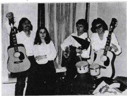
Grupul folk P 600:

Realitatea este că, așa cum am consemnat anterior, am avut rezultate la nivel național la dans tematic cu copiii Școlii Negreni. Deci, veneam cumva pregătit și pentru acest domeniu, mai ales că în facultate am făcut cursuri de dans folcloric și pregătire de dans contemporan în Ansamblul „Gymnasion” al IEFS-ului, iar în primul an de stagiatură am făcut parte și din ansamblul folcloric de la Scornicești.