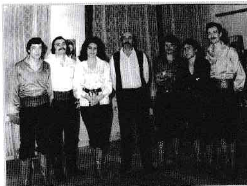
Aici cu Tudor Gheorghe.

la înființare și la apogeu... când susțineam concerte.